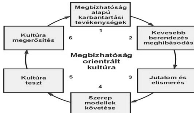
6. ábra: Modell a nyomdaüzemek karbantartási-szervezési rendszerének kialakításához.

A módszert több nyomdában teszteltük, ahol sikeresen be is építették a karbantartás fejlesztés folyamatába.