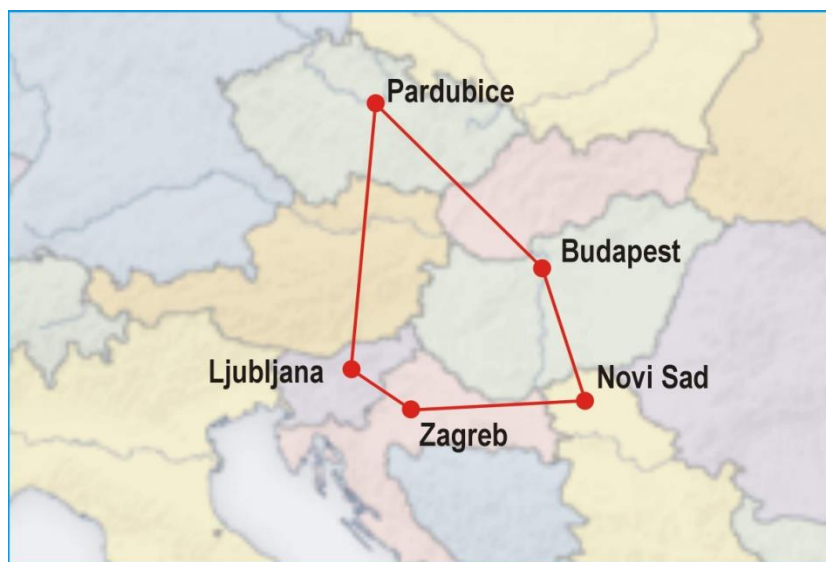
2. ábra: Az öt együttműködő egyetem, térképen

A félidőn túl értékelve az eddigi együttműködést, az igazán sikeresnek mondható. Ebből a mutatunk be példákat.