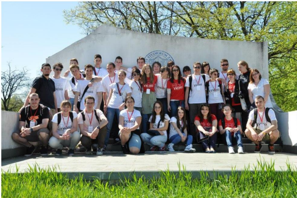
3. ábra: Az ING'2013 verseny résztvevői

Sajnos a Zágrábi Egyetem Nyomdaipari Karán a dékánváltás miatt az idei verseny szervezésében gondokat okozott, de reméljük, hogy nem szakad meg ez a kiváló kezdeményezés.