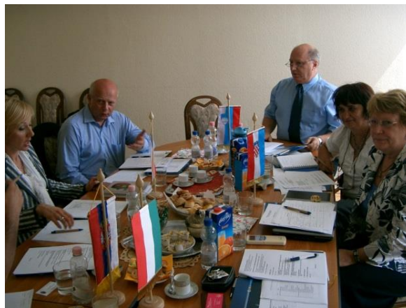
1. ábra. A 5U CHEGA megállapodás aláírása Budapesten