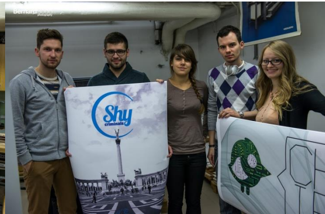
5. ábra: Vidáman készülnek az alkotások a workshopon

Kellemes meglepetés volt a külföldi diákok számára a szentendrei kirándulás. A jelentős szerb és horvát örökséggel és kultúrával rendelkező városról eddig nagyon keveset tudtak. A házigazda magyar diákok gondoskodtak arról, hogy az esték se teljenek eseménytelenül. A legnagyobb élmény a vendégek számára természetesen az egyetemi gólyabálon való részvétel volt.